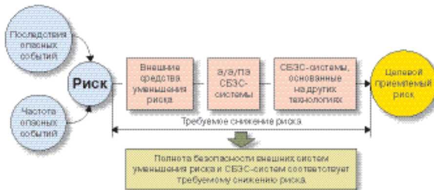
Риск и полнота безопасности

В стандартах ГОСТ Р 53195 рассмотрены системы, связанные с безопасностью зданий и сооружений (СБЗС-системы), установленные на этих объектах и взаимодействующие с системой конструкций и другими инженерными системами, на всех стадиях их жизненного цикла. К классическим инже-